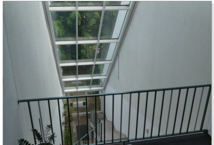
9577 Hausflur innen