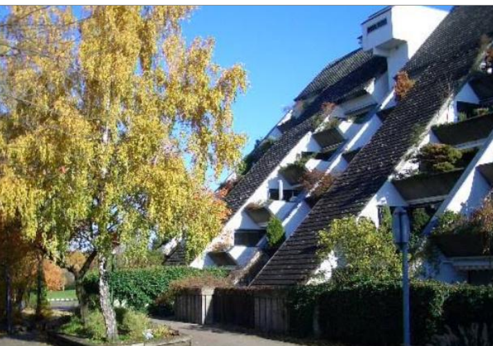
9577 Seitenblick Color