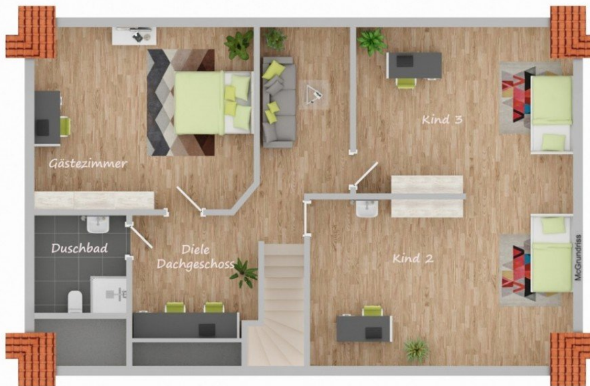
9574 DG beschriftet