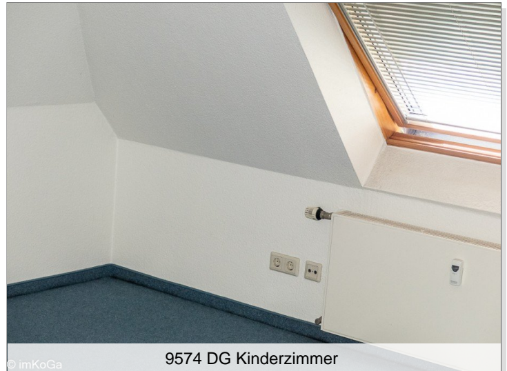
9574 DG Kinderzimmer