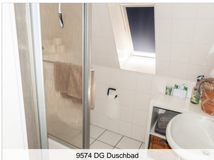
9574 DG Duschbad