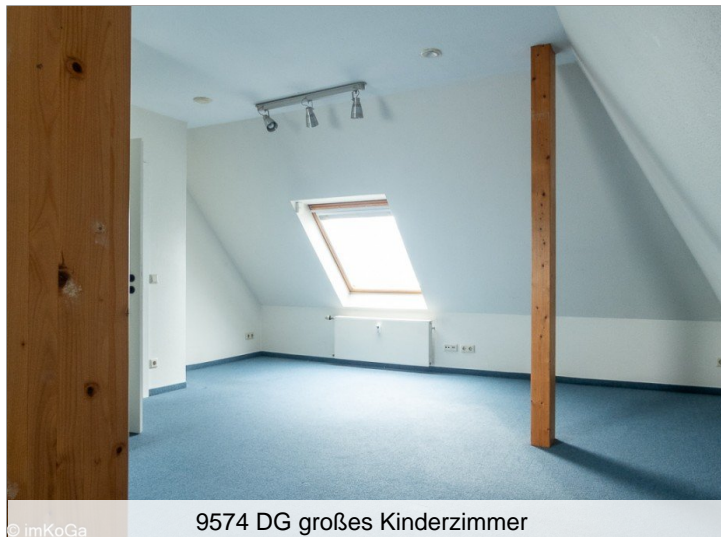
9574 DG großes Kinderzimmer