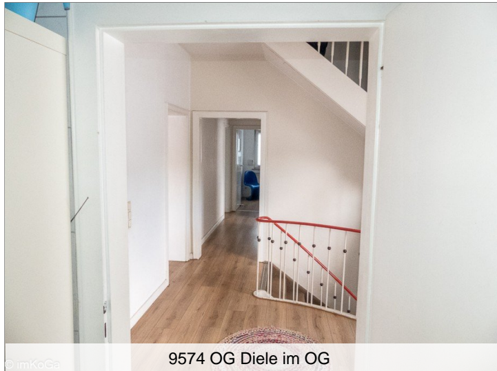
9574 OG Diele im OG