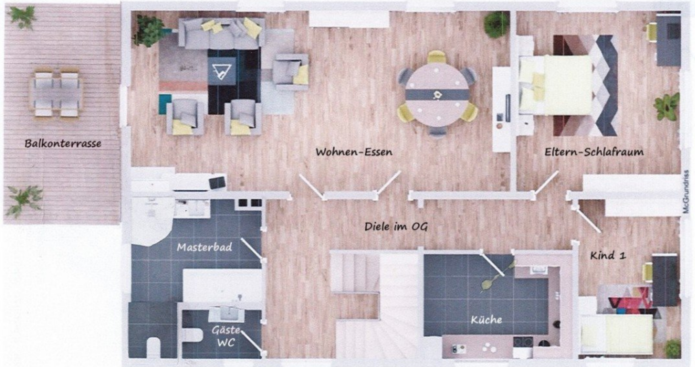
7469 OG Grundriss beschriftet