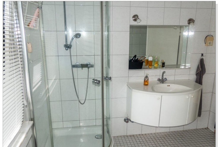
9574 OG Masterbad