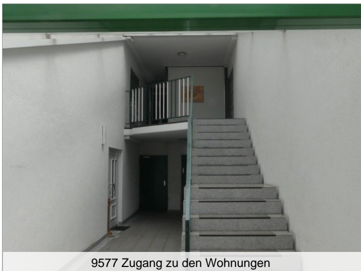
9577 Zugang zu den Wohnungen